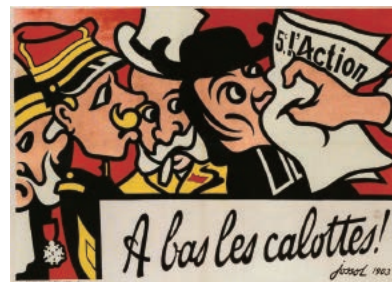
アンリ・ギュスターヴ・ジョソ『頭の固い奴らを倒せ!』1903年 Gustave-Henri Jossot, Public domain, via Wikimedia Commons

お申込み／左記2次元コード、 もしくは下記URLまで https://fmfj-20250610.peatix.com/