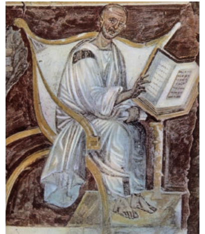
最古のアウグスティヌス肖像 (6世紀頃、ラテラノ宮殿内スカラ・サンタ)

お申込み / 左記2次元コード、 もしくは下記URLまで https://fmfj-20250425.peatix.com/